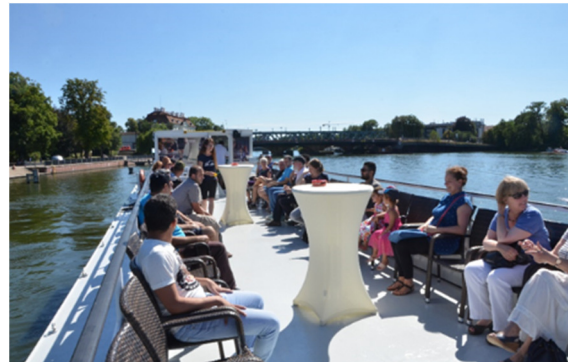
Abb. 04 und 05: Allendefest 2018 und Dampferfahrt 2018