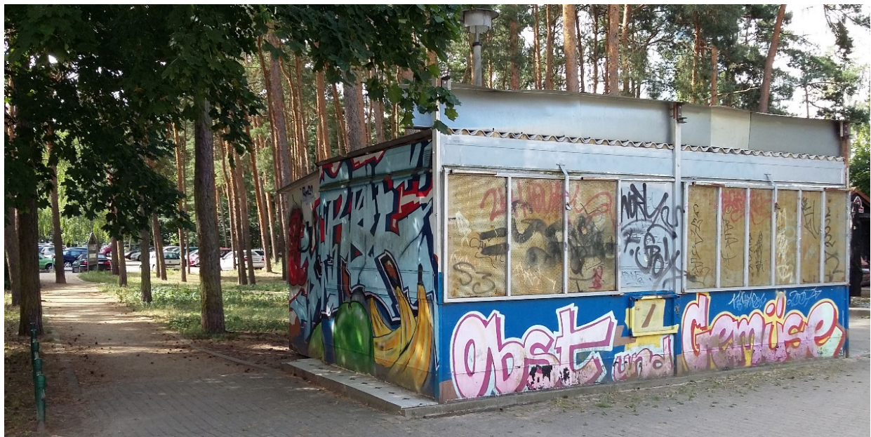
Abb. 02: Obstkiste

Beim Nachbarschaftsforum waren sich alle Teilnehmenden einig, dass keine 16.600 Euro aus BENN-Mitteln für die Instandsetzung verwendet werden sollen. Außerdem ist nach aktuellen Plänen die Nutzungsdauer an die Programmlaufzeit von BENN gekoppelt. Im Jahr 2021 würden demnach weitere Kosten für die Beräumung der Obstkiste anfallen. Hier sehen die Teilnehmenden des Nachbarschaftsforums kein sinnvolles Kosten-Nutzen-Verhältnis, da das Geld dann an anderer Stelle im Kiez fehlen würde.